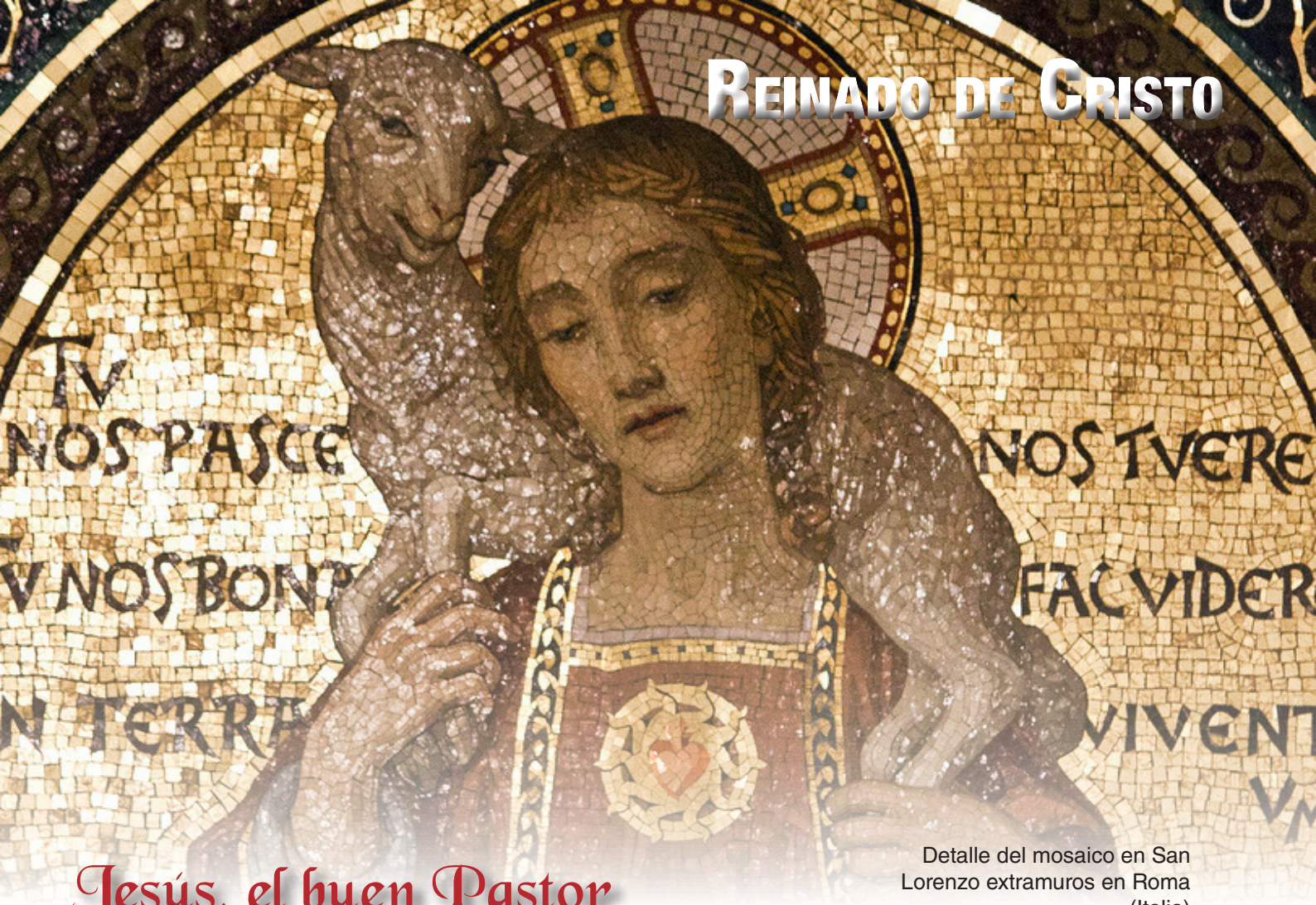
Detalle del mosaico en San Lorenzo extramuros en Roma (Italia)